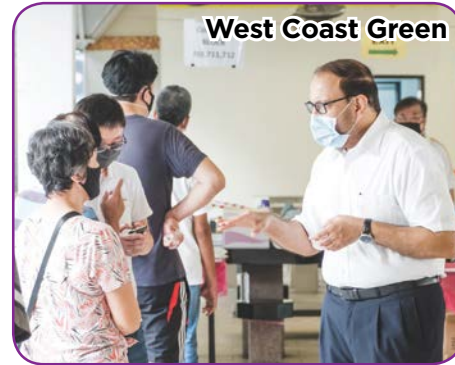
West Coast Green