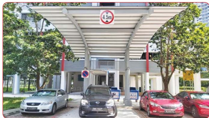
West Coast Ville