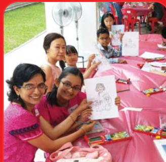
West Coast Heights Block Party