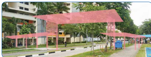
High & low covered walkway between Block 716 & 722 Clementi West Street 2