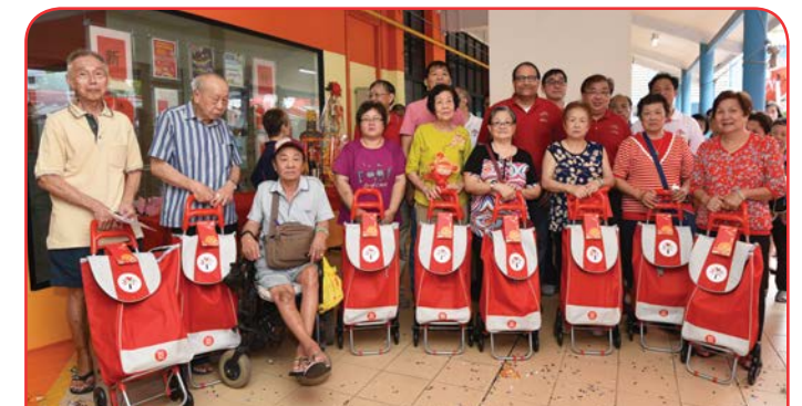
Pioneer Generation Appreciation

More than 4,500 seniors have benefitted from their Merdeka Generation Package