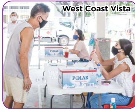
West Coast Vista