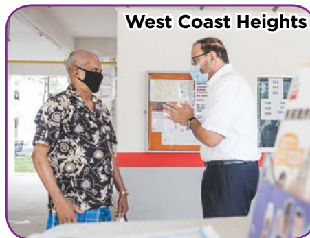
West Coast Heights