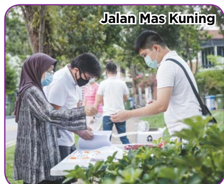
Jalan Mas Kuning