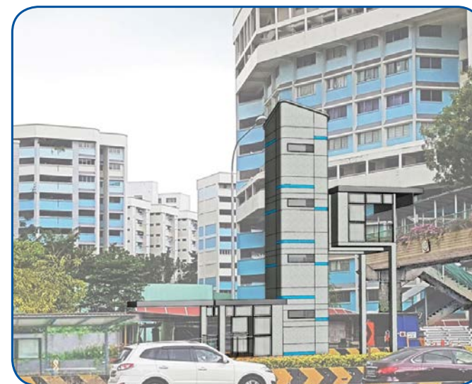
Beside Block 610 Clementi West Street 1

Construction of Lifts at 3 Pedestrian Overhead Bridges at AYE for better accessibility