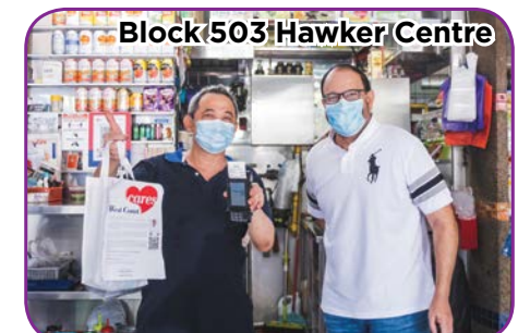
Block 503 Hawker Centre