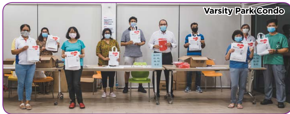
Varsity Park Condo