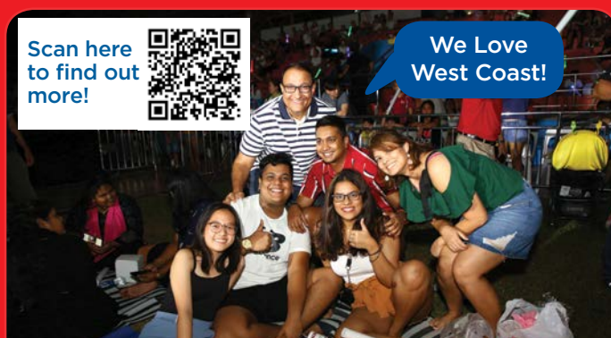
West Coast Rocks Concert