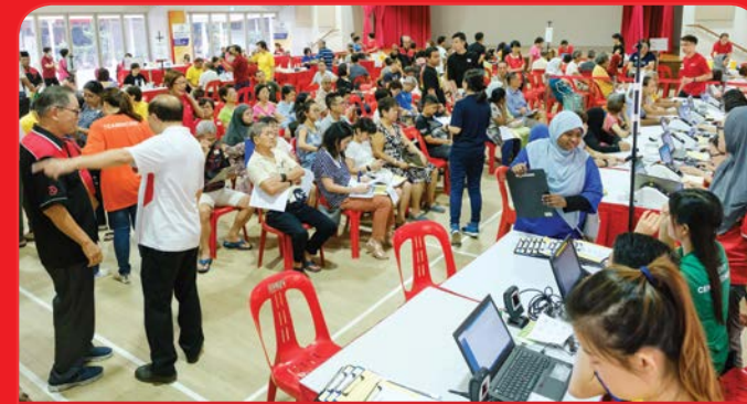
Health Carnival @ West Coast