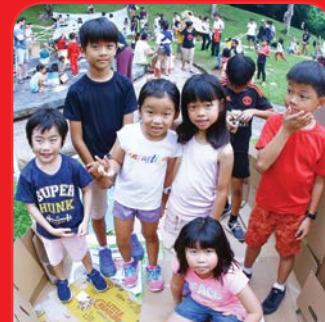
Pop-Up Playground @ Clementi Woods Park