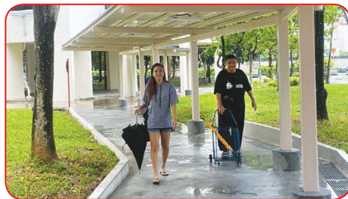
West Coast Green

All eligible blocks in West Coast have completed the Lift Upgrading Programme