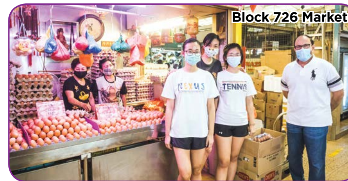
Block 726 Market