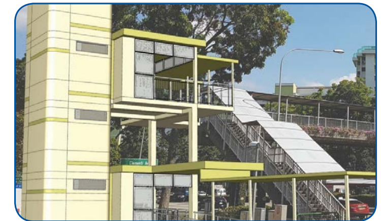
Next to the Parc Condo at West Coast Walk