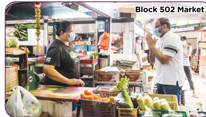
Block 502 Market