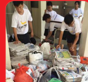
March to Charity