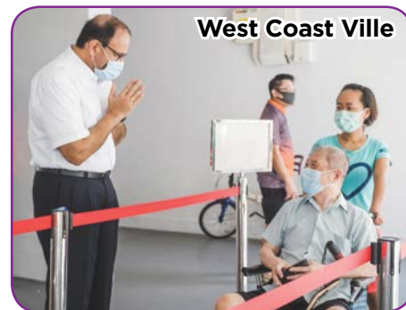
West Coast Ville