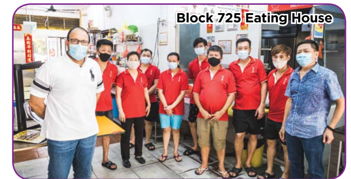
Block 725 Eating House