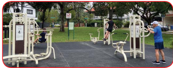
Taman Mas Merah