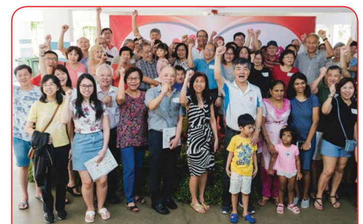
Merdeka Generation Package Presentation