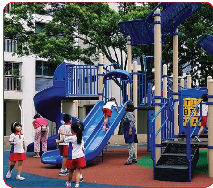
West Coast Vista