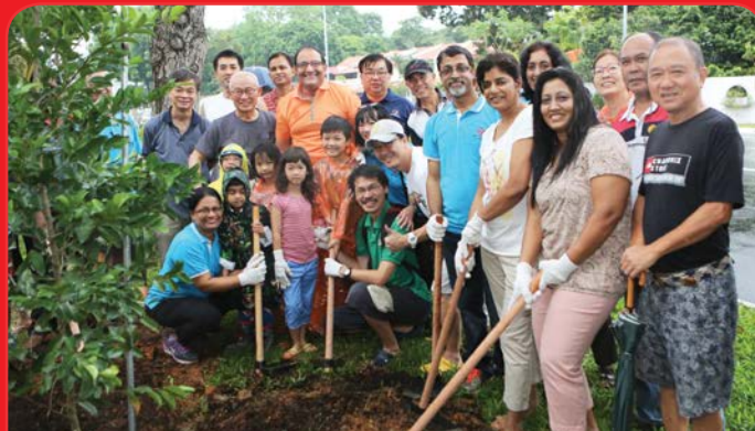
Tree Planting along West Coast Road