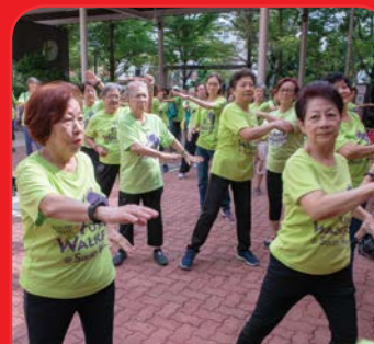
Seniors' Fitness Exercise Group