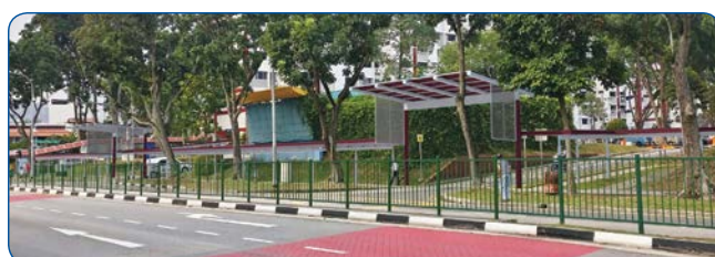
High & low covered walkway between Block 601 & 609 Clementi West Street 1 to existing bus stop