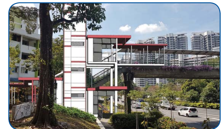
In front of Block 506 West Coast Drive